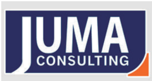
Juma Consulting | España